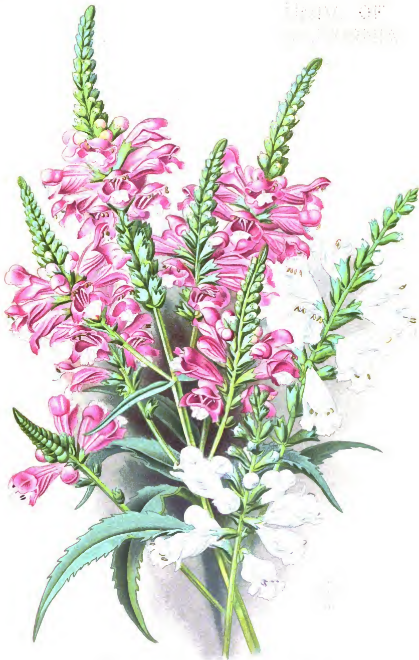
Physostegia virginiana et var. alba .

Физостегія виргинская и ея разновидность съ бѣлыми цвѣтами.